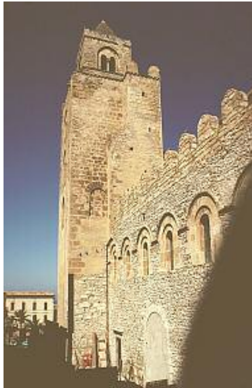
کاتیدرالی سیفالو Cefalu